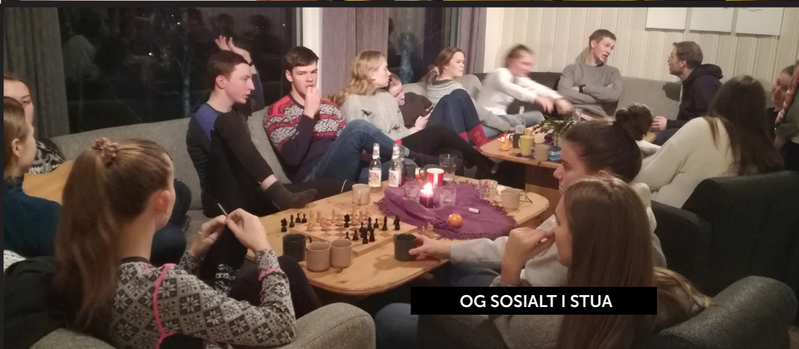
OG SOSIALT I STUA