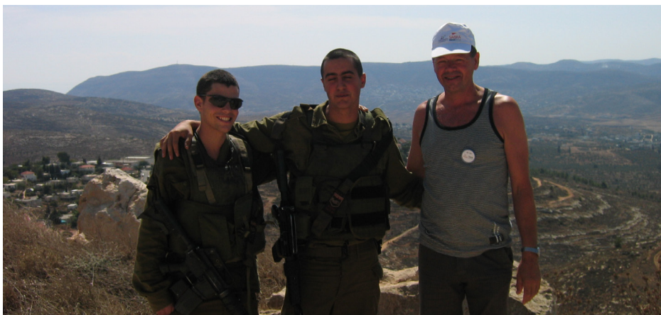
Hilsen soldat i 73/74 Sankp. Tropp2 Bårebærer og sannitetstropp. 258 Sele