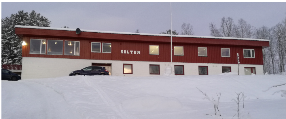
Soltun Soldatheim, desember 2018

Gjennom de menneskene som Soltun samler, vennskap, møtene som blir arrangert der og det fristedet som Soltun er har jeg blitt bevart i troen, fått åndelig føde og vært med andre kristne søsken. Da jeg selv var soldat på Setermoen kjente jeg mer enn noen gang på viktigheten av å kunne ha en stødig kristen venneflokk som samlet seg på Soltun og hørte solid forkynnelse og sang sammen. Dette er særlig viktig i et så hardt miljø som forsvaret kan være.